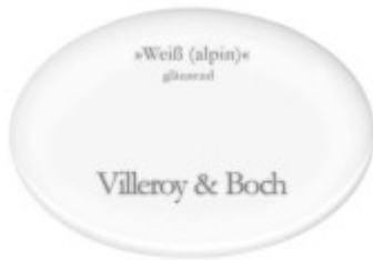
Reis weißer Grundteller ohne Tischkante - glänzend Die Abbildung ist stark vergrößert (Originalgröße: 35 mm x 45 mm)